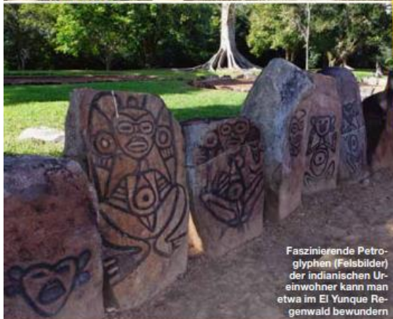
Faszinierende Petroglyphen (Felsbilder) der indianischen Ureinwohner kann man etwa im El Yunque Regenwald bewundern