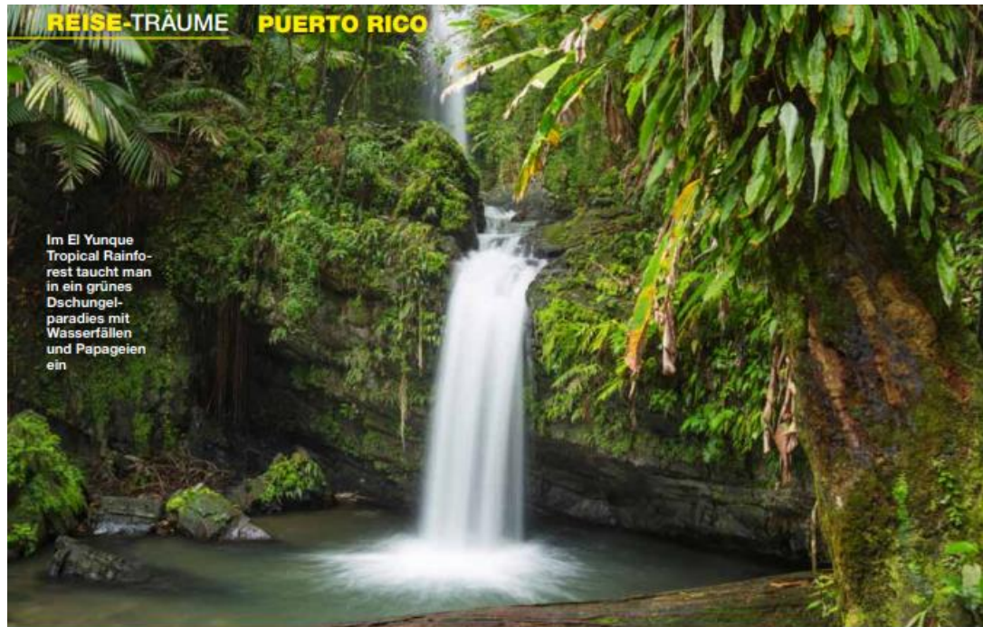
Im El Yunque Tropical Rainforest taucht man in ein grünes Dschungelparadies mit Wasserfällen und Papageien ein