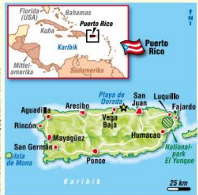
Karte: Pixankle

Tipp: Wer sich vom Inselosten in den Westen bewegen will, sollte mit einem Mietwagen die Ruta Panorámica nehmen (Eine Karte gibt es im Touristenbüro). Die 265 Kilometer lange Panoramastraße führt durch das ländliche und bergige Inselherz an kleinen Dörfern vorbei. Einen Abstecher nach Ponce , der zweitgrößten Stadt, lohnt sich dabei. Vor den Stadttoren liegt der Tibes Indian Ceremonial Park , in dem einst die Ureinwohner, die Taino-Indianer, eine Art Fußball spielten. In einem nachgebauten Dorf wird das alte, indianische Leben erfahrbar.