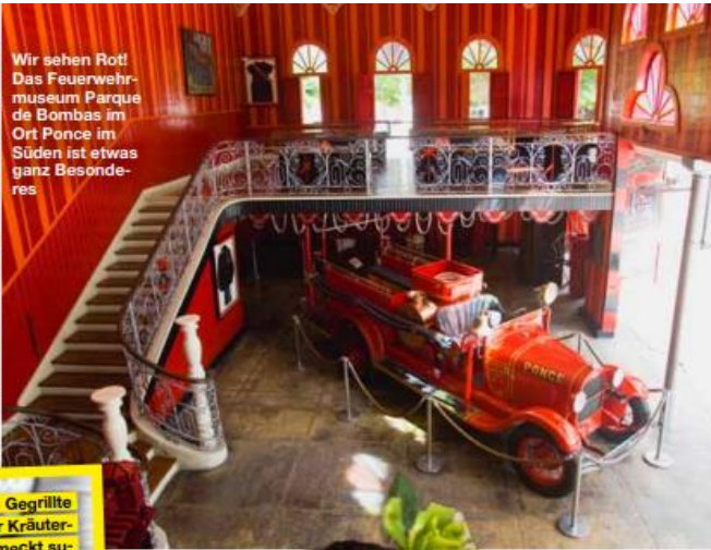
Wir sehen Rot! Das Feuerwehrmuseum Parque de Bombas im Ort Ponce im Süden ist etwas ganz Besonderes