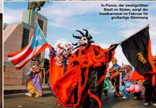
In Ponce, der zweitgrößten Stadt im Süden, sorgt der Inselkarneval im Februar für großartige Stimmung