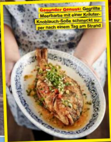
Gesunder Genuss: Gegrillte Meerbarbe mit einer Kräuter-Knoblauch-Soße schmeckt super nach einem Tag am Strand