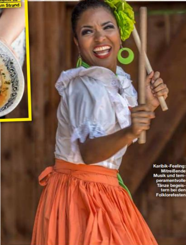
Karibik-Feeling: Mitreißende Musik und temperamentvolle Tänze begeistern bei den Folklorefesten