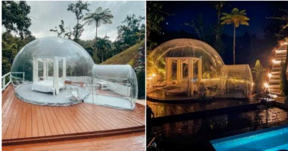
Yep, this social bubble will do nicely

This bubble hotel could be perfect if you're dreaming of a luxury escape post-coronavirus.