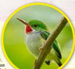
Der putzigste Vogel der Welt: Der Gelbflankentoucan ist nur elf Zentimeter groß und es gibt ihn nur auf Puerto Rico

gefühl. Allerdings mit viel spanisch-lateinamerikanischem Einschlag . Schließlich war Puerto Rico einst eine Kolonie der Spanier. Und das erlebt man nirgendwo besser als in der Altstadt von San Juan : Schon von Weitem sieht man die mächtigen Mauern mit Türmen und Zinnen der Festung San Felipe del Morro . Hier bummelt man mit einem leichten Gruselschauer durch unterirdische Gänge und einstige Verliese, in denen die Feinde der Spanier nichts zu lachen hatten (Eintritt 5 Dollar). Doch auch die zweite Festung, San Cristóbal , ist