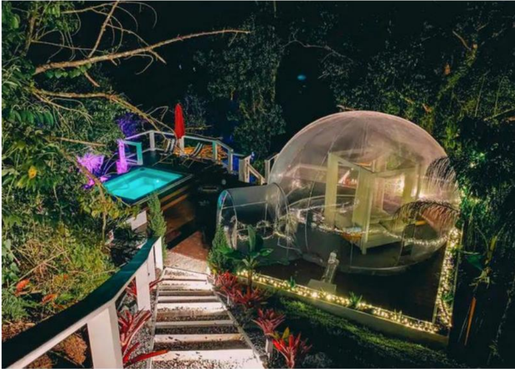
📍 The dome is perfect for social distancing

The great thing about it all is that there's also air conditioning sorted, multi-outlet charging points and a decent phone signal.