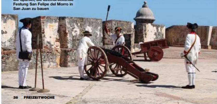
Geschichtsstunde mit Kanonenschuss: Ab 1539 begannen die Spanier, die beeindruckende Festung San Felipe del Morro in San Juan zu bauen