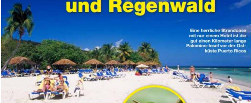
Eine herrliche Strandoase mit nur einem Hotel ist die gut einen Kilometer lange Palomino-Insel vor der Ostküste Puerto Ricos

Die Palmen rauschen im Wind, das Meer leuchtet türkisblau und am Strand stecken die Füße in puderfeinem, schneeweißem Sand: Willkommen in Puerto Rico!