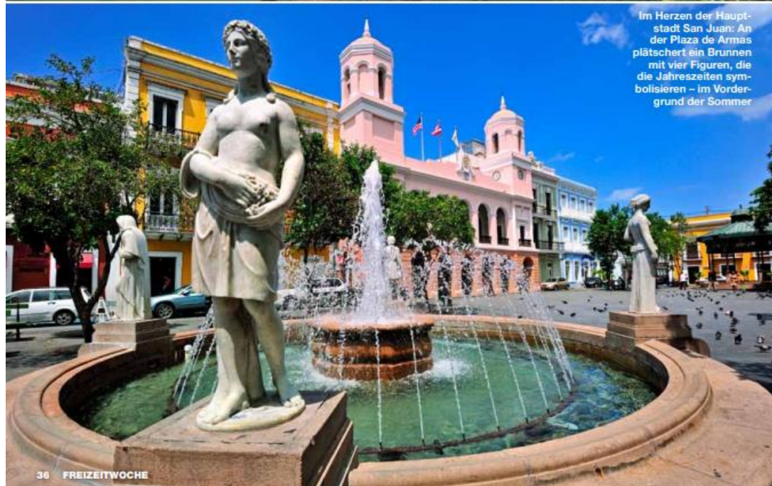
Im Herzen der Hauptstadt San Juan: An der Plaza de Armas plätschert ein Brunnen mit vier Figuren, die die Jahreszeiten symbolisieren – im Vordergrund der Sommer