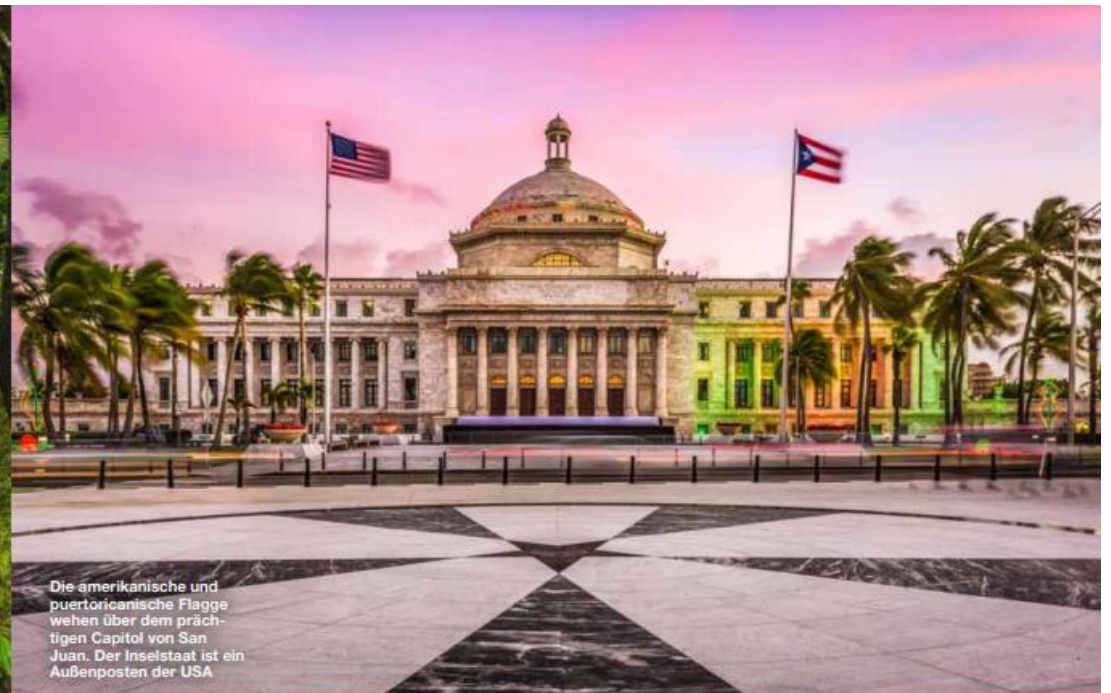
Die amerikanische und puertoricanische Flagge wehen über dem prächtigen Capitol von San Juan. Der Inselstaat ist ein Außenposten der USA