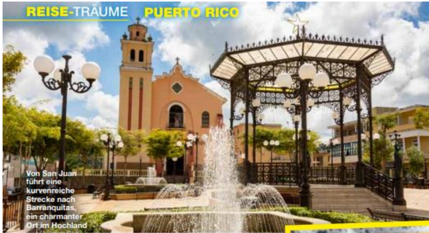
Von San Juan führt eine kurvenreiche Strecke nach Barranquitas, ein charmanter Ort im Hochland