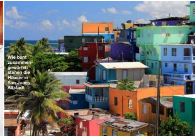
Wie bunt zusammengewürfelt stehen die Häuser in San Juans Altstadt