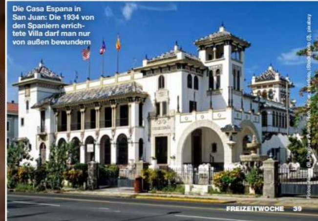
Die Casa Espana in San Juan: Die 1934 von den Spaniern errichtete Villa darf man nur von außen bewundern