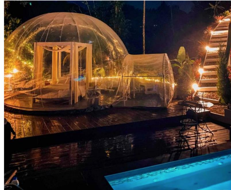
📍 The Airbnb offers 360-degree views

The owner of Bubble Puerto Rico wrote on Airbnb : "Imagine sleeping in a bubble room, bathing in hot water outdoors surrounded by nature, taking a dip in the river."